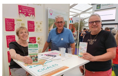
CCFC à Tilloy-les-Mofflaines et Hucqueliers les 11 juin et 26 novembre 2022