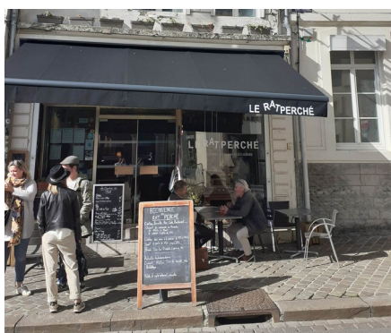
Entr’Citoyens du 06/10/2022 au Rat Perché

Au total, 8 porteur.euses ont été reçu.es par une équipe constituée de bénévoles et d’un salarié de l’association régionale. Des grilles d’analyse des projets ont été rédigées à la suite de ces ateliers par les cigalier.es présent.es afin de les partager et les rendre accessibles à l’ensemble des cigalier.es du Pas-de-Calais.