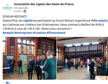
Communication sur la page LinkedIn de l'association régionale